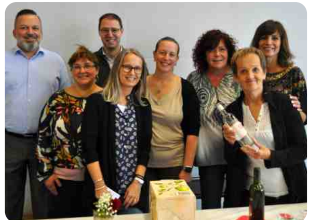
Membres de la Municipalité et l'équipe du service