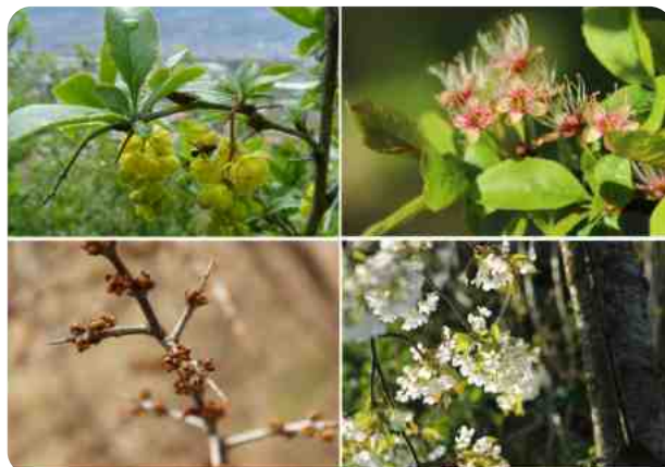
© Atelier Nature et Paysage & David Bärtschi Epine-vinette, amélanchier ovalis, argousier, merisier.

N'hésitez pas à demander conseils auprès d'un pépiniériste ou paysagiste.