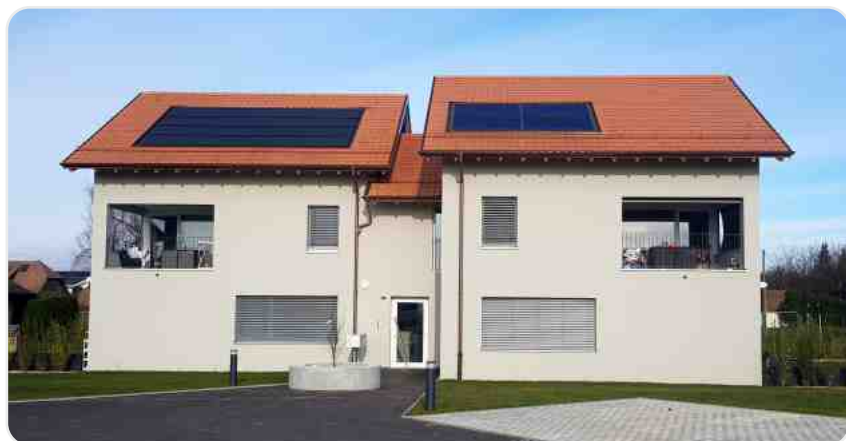
Locatif communal de Moille-Sullaz