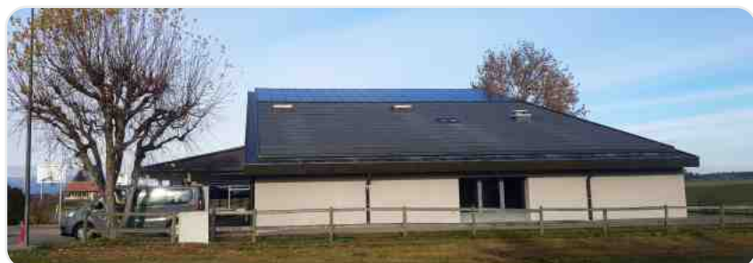
Panneaux photovoltaïques pour le système de chauffage de la grande salle