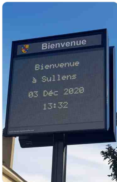
Panneau d'information, Route de Cheseaux